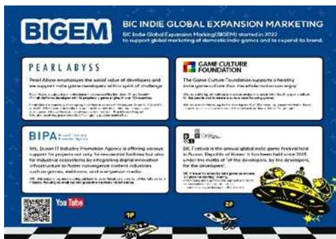
BIGEM 2기 인쇄 제작물 예시